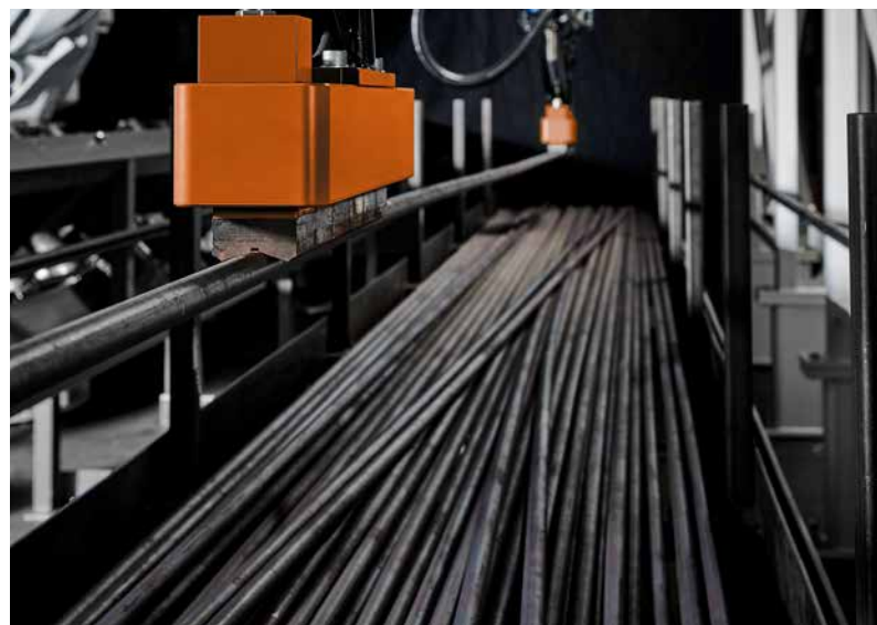
Selbst chaotische Anordnungen können entladen werden

3D-Sensor Messkopf zur Lokalisierung der Stäbe