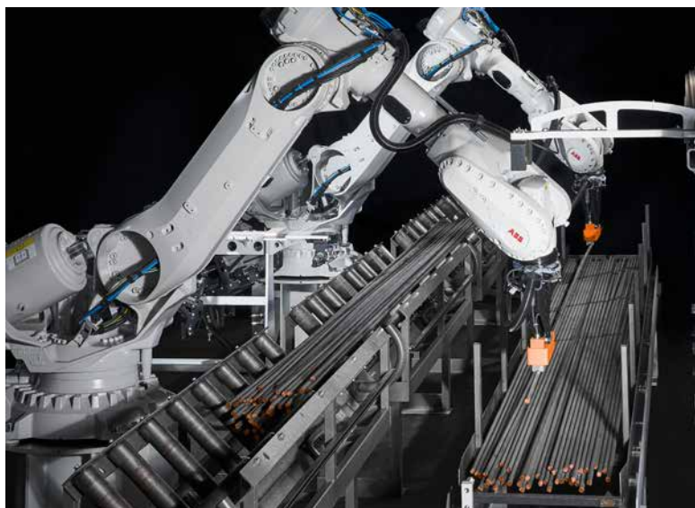
Stabentnahme mit einem Magnetgreifer durch KASTOpick bar

Keine Programmierung oder Teach-in durch den Anwender erforderlich